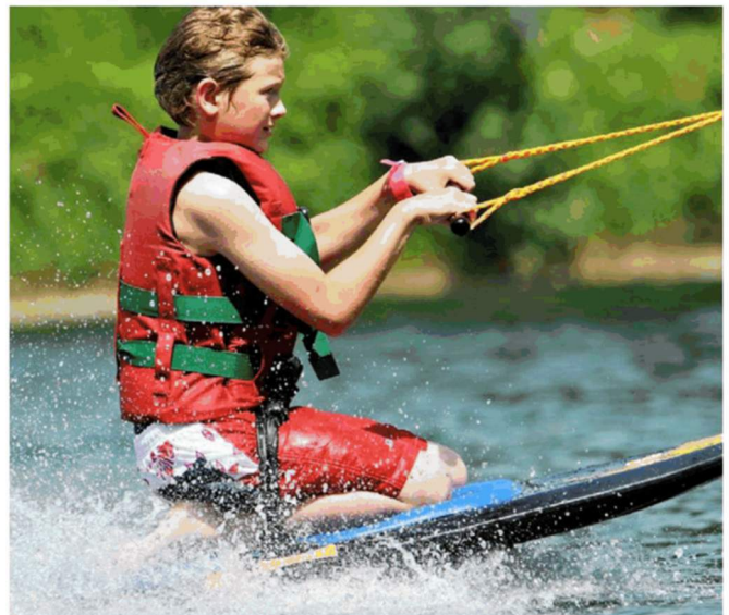
Im Großraum Linz gibt es einiges zu erleben.

Die Testergebnisse spiegeln die subjektive Beurteilung der Tester wider. Kein Anspruch auf Vollständigkeit.